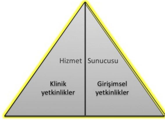
Şekil 2- TUKMOS yedinci temel yetkinlik alanı: Hizmet Sunucusu

Klinik ve girişimsel yetkinlikler edinilirken ve uygulanırken Temel Yetkinlik alanlarında belirtilen diğer yetkinliklerle uyum içinde olmalı ve uzmanlığa özel klinik karar süreçlerini kolaylaştırmalıdır.